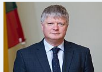
Lietuvos Respublikos aplinkos ministras Kęstutis Navickas

rinkai ( angl. close-to-market ) sprendimus, t. y. turinčius klimato kaitos švelninimui ar prisitaikymui bei galinčius paraišką gali teikti Europos Sąjungoje įregistruoti juridinių asmenų (įstaigų) projektams.